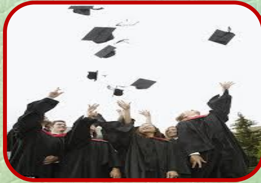
مستوى الجامعات ومراكز الأبحاث العلمية