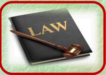
توفير الخدمات القانونية

تقوم حاضنات الأعمال التقنية بتقديم حزمة من الخدمات المتنوعة التي تساعد المنشآت المحتضنة على النمو والتطور، وتمثل هذه الخدمات المقدمة في العناصر الأساسية التالية: