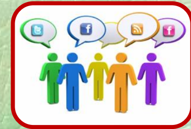
بناء شبكات التواصل