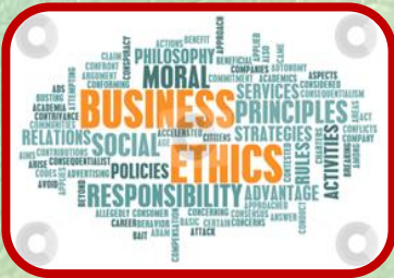
التعريف بأخلاقيات العمل