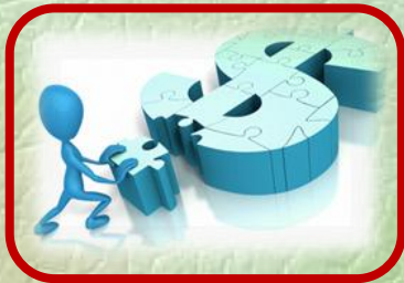
تسهيل الوصول إلى مصادر التمويل