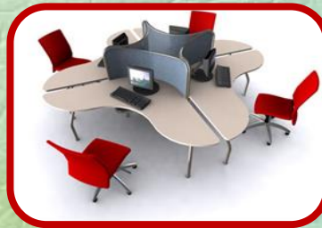
توفير الأماكن والمكاتب والمجهزة