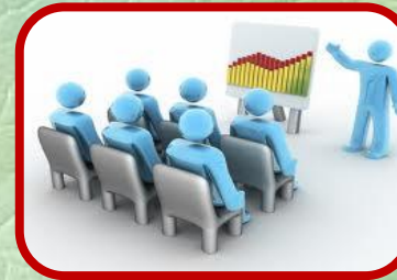
توفير العديد من الخدمات