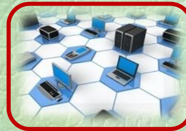
توفير المرافق المتعلقة بالبنية التحتية