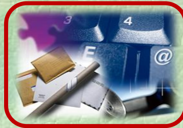
تقديم خدمات التدريب المختلفة